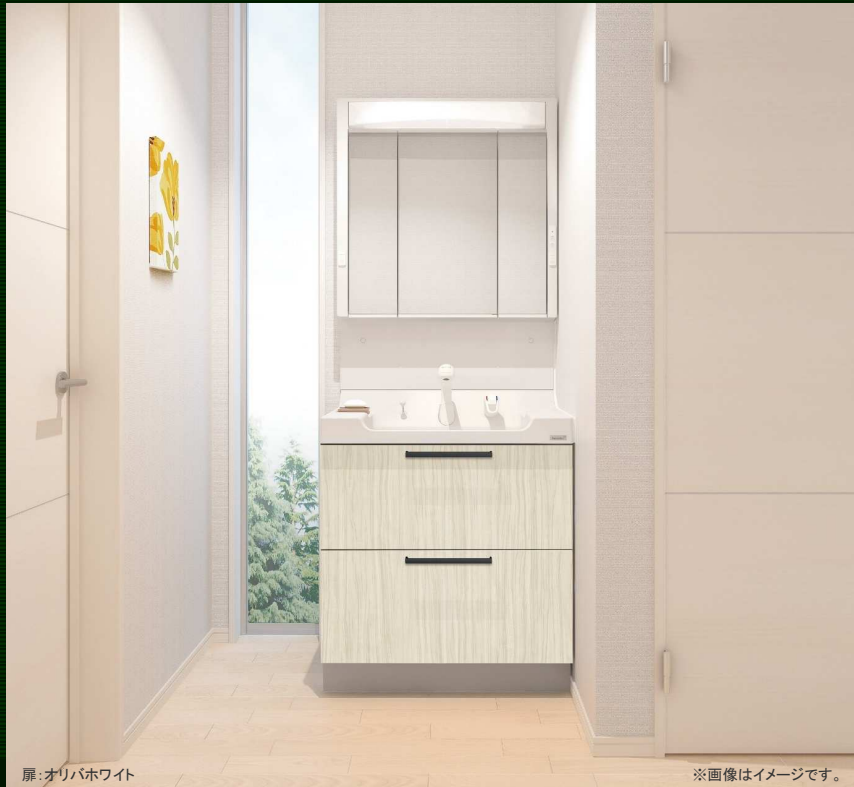
扉:オリバホワイト

家族ひとりひとりの使い方と心地よさにフィットする機能とデザインを詰め込んだ洗面化粧台です。